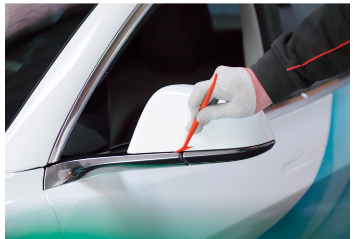
Excelente conformabilidad 3D para proyectos exigentes de rotulado de vehículos y flotas.

Para obtener información adicional, póngase en contacto con su representante de ventas o visite la página web de Avery Dennison Web en: graphics.averydennison.es/sp1504