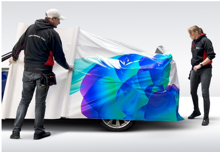
Facilidad de reposicionamiento gracias a la tecnología Easy Apply™ y al bajo agarre inicial.