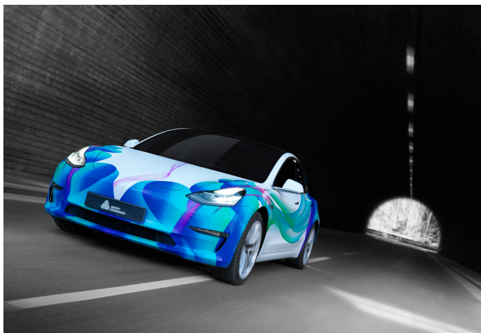
Excelente durabilidad en exterior, hasta 10 años sin imprimir y 6 años impreso*.